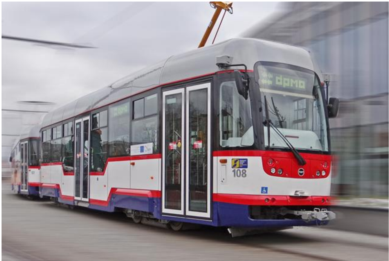
Umístění loga IDSOK na železničním vozidle

Rozměry samolepky s logem pro umístění na vozidle jsou 27,8 cm x 14,5 cm.