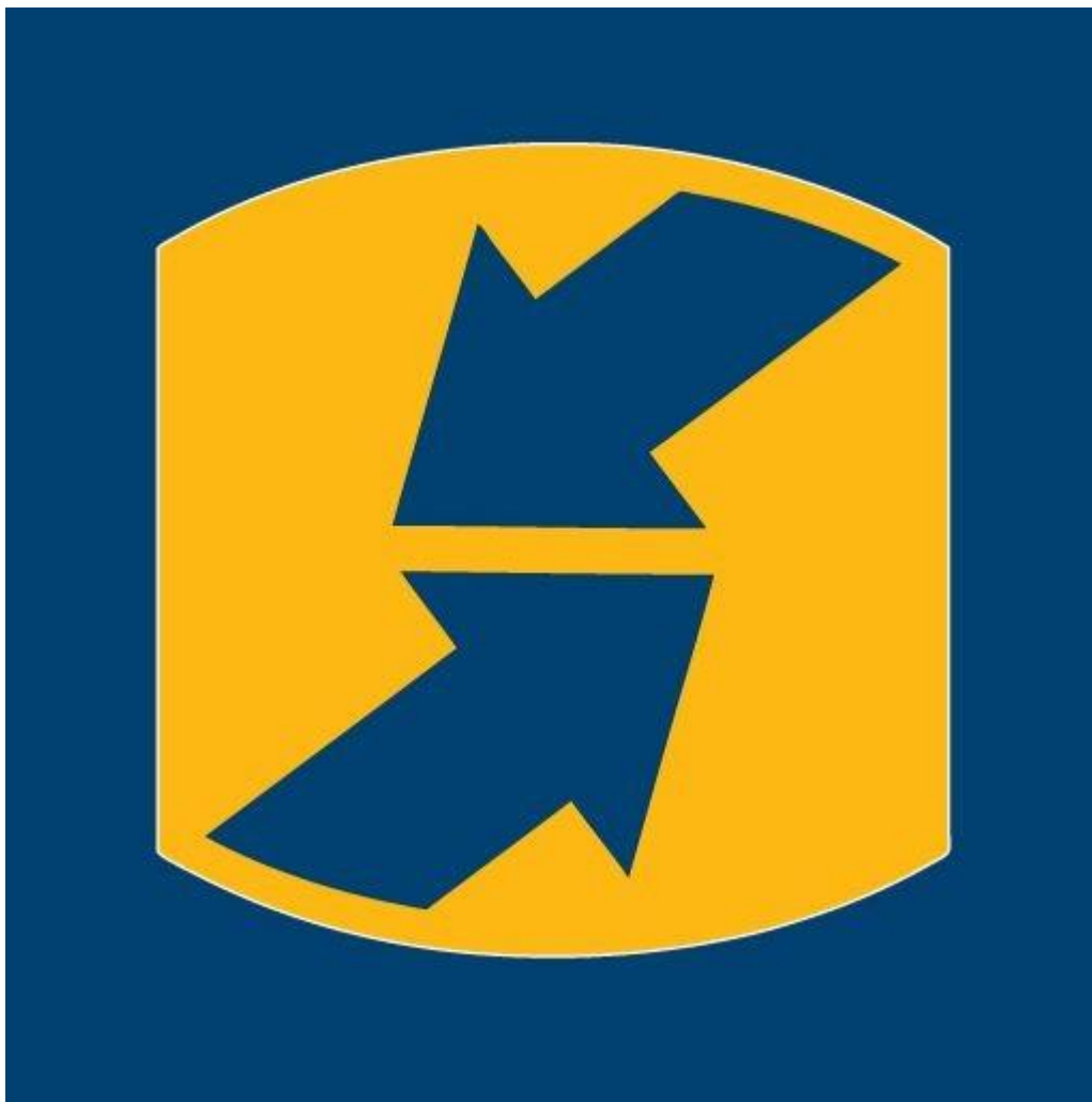
Část loga IDSOK

Logo IDSOK je KIDSOK poskytováno dopravcům pouze pro účely realizace veřejné dopravy v rámci režimu IDSOK.