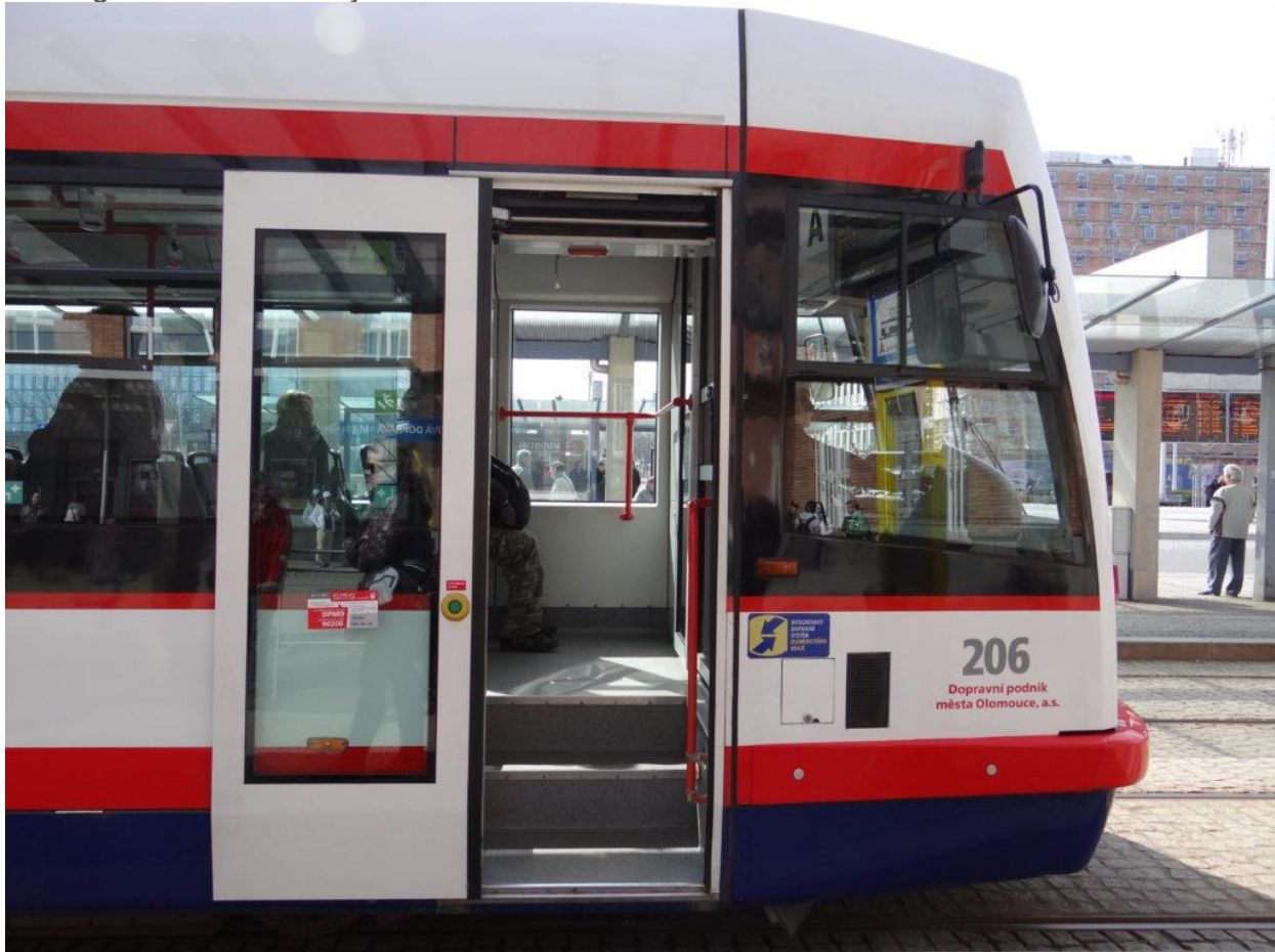
Umístění loga IDSOK na vozidle

Dopravci zajišťující dopravní obslužnost v rámci IDSOK mají povinnost označit vozidla logem IDSOK. Logo na autobusech a tramvajích je umístěno na pravé přední oblině vozu tak, aby mohlo být snadno vnímáno cestujícím při příjezdu vozidla do zastávky a při nastupování do vozu. Umístění loga názorně ukazuje obrázek: